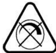
Рисунок 1. Регулирование силы света не допускается

(б) Специальные условия или ограничения, которые необходимо соблюдать при работе лампы, например, работа в схемах с регулятором силы света. Если лампы не пригодны для работы в схемах с уменьшением силы света? должен быть указан следующий символ, приведенный на рисунке 1;